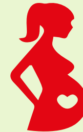
Phụ nữ mang thai 女性携带泰国 Pregnant women