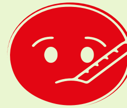
Người bệnh 病人 Patient