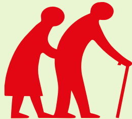
Người già 老人 Elder person